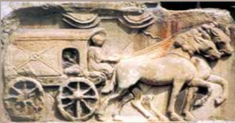
Abb. Römischer Reisewagen (Relief in Maria Saal, Kärnten)

Bei klarem Wetter hat man auch heute diesen weiten Blick ins Moseltal bis zur Stadt Trier. Aus der Stadt ragt die Basilika heraus, die ehemalige römische Palastaula, in der der römische Kaiser damals seine Gäste empfing.