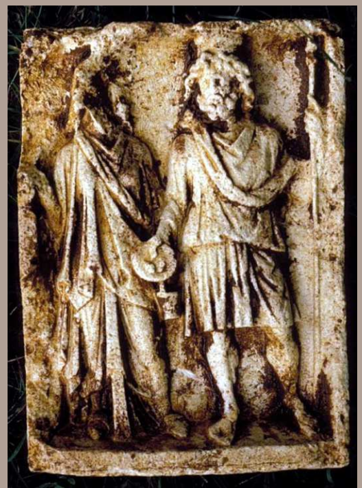
Steinrelief vom Götterpaar Isis und Serapis